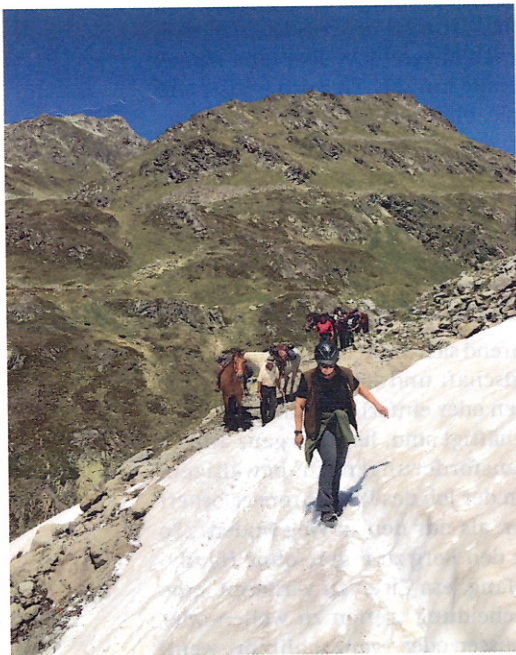
Vorsichtiges sich Vorantasten über den Schnee

Während wir Reiter:innen die Pause auf der Keschhütte für eine Jause nutzen, sitzt Men hinter dem Gebäude auf einem Stuhl, die Enden der elf Führstricke liegen lose in