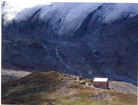
Keschhütte vor dem Gletscher Vadret da Porchabella

Während sich die Reiter:innen an Pferd, Landschaft und Abgeschiedenheit erfreuen oder einfach nur mit sich selbst beschäftigt sind, hat Men ganz andere Herausforderungen zu bewältigen. Denn der Job des Rittführers erfordert mehr, als nur den zu Weg finden. „So über den Berg zu reiten, ohne Handyempfang, ein Eisen zu verlieren, eine Entscheidung treffen zu wollen oder zu müssen oder – ganz schlimm – wenn einem Gast etwas passiert ... das ist