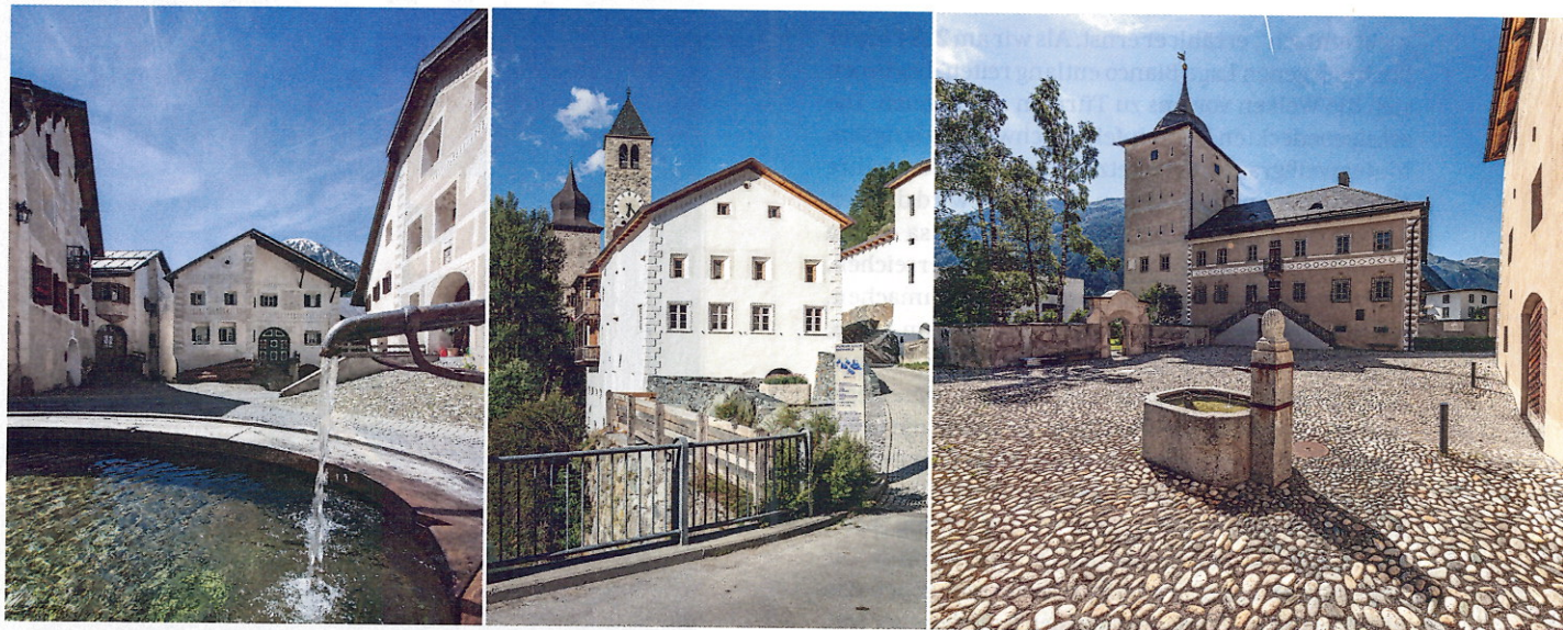
Am Weg der Reitwanderer liegen idyllische Engadiner Bergdörfer wie Guarda (li.), Susch (Mi.) und Zernez (re.), in denen überwiegend Rätoromanisch gesprochen wird.