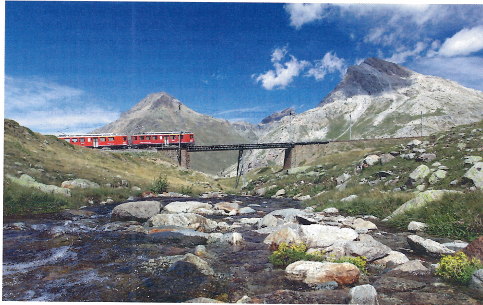
Berninalinie der Rhätischen Bahn auf den Berninapass: Sie gilt als eine der steilsten Adhäsionsbahnen der Welt.